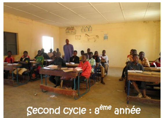
Second cycle : 8 ème année

La cantine pour cette année scolaire est autonome et les enfants payent 0,40 euros /mois (250 CFA).