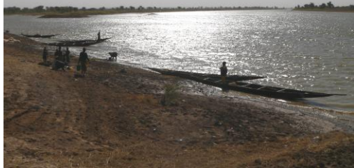
Le Bani à Koloni (affluent du Niger)