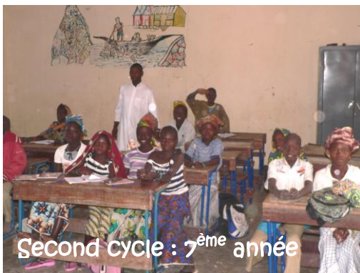
Second cycle : 7 ème année